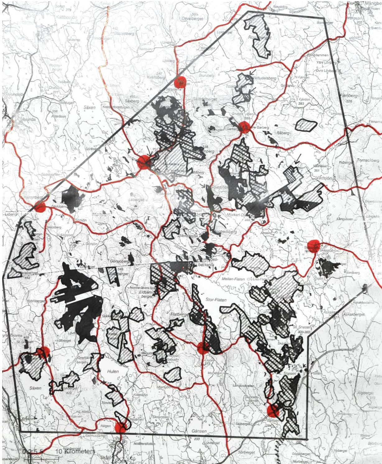
Tänkbara portalplatser och tillfartsvägar