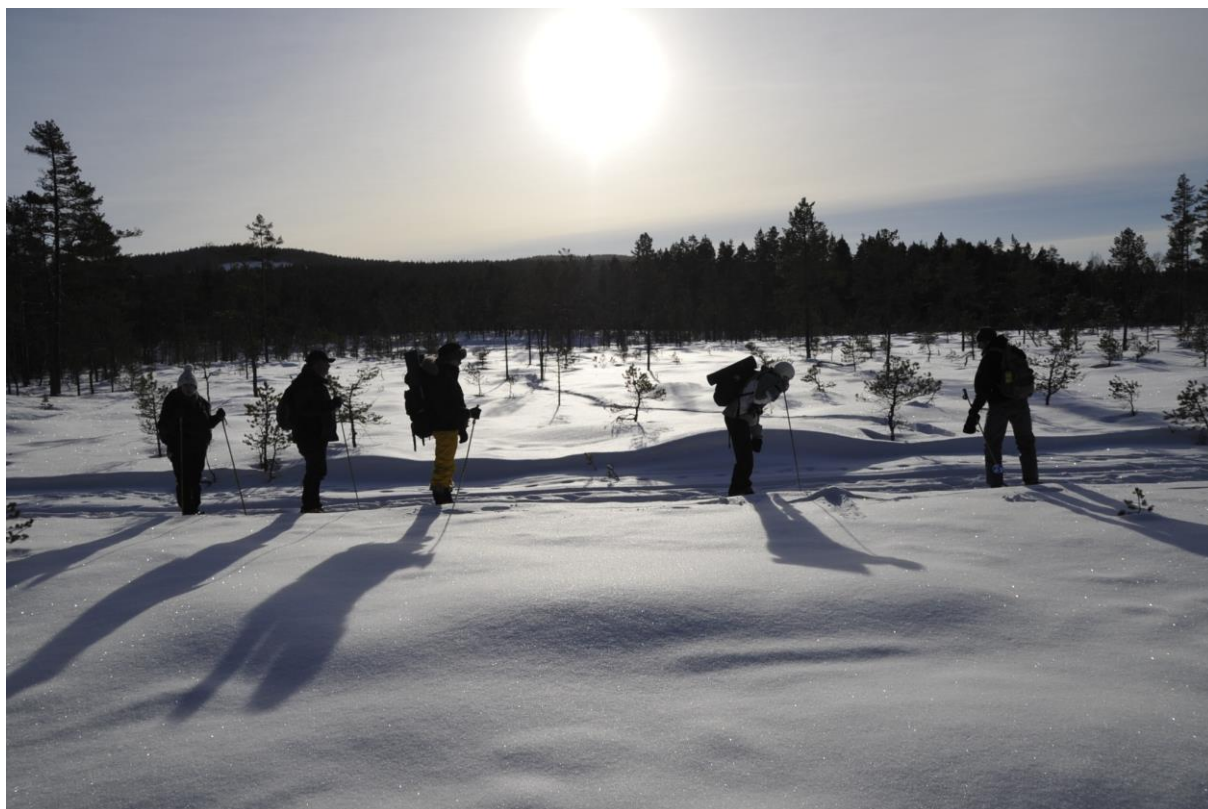
Brittiska turister på vargspårning i Vildmarksriket vintern 2011.

Denna naturvårdssatsning har medfinansierats genom statsbidrag förmedlade av Länsstyrelsen Dalarna