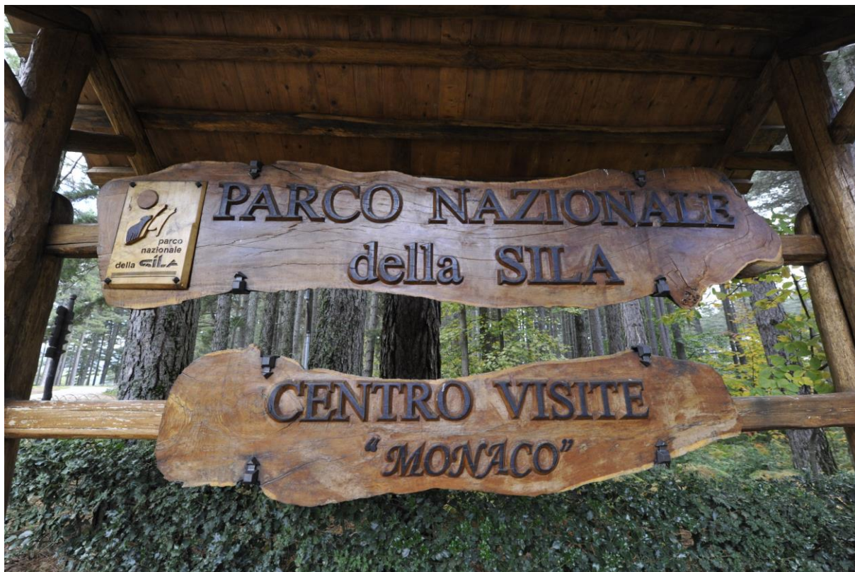
Exempel på portalskylt och faunaskylt, Sila Nationalpark, Italien