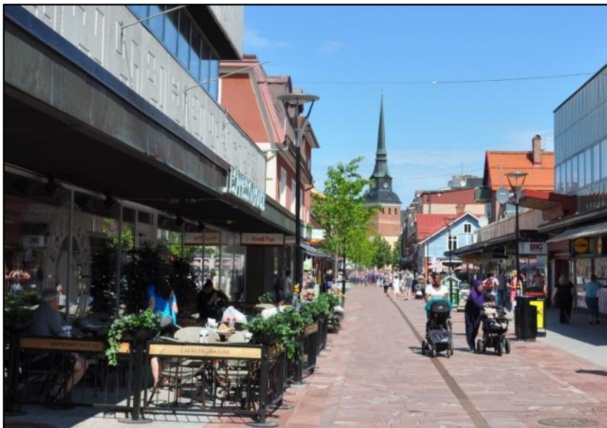
Bild ovan visar uteservering som hålls inom möbleringszon närmast fastighet.