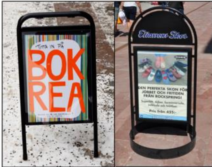
Bild ovan visar en felaktigt utformad gatupratatort samt en korrekt utformad gatupratatort. Felaktigt utformade och uppställda gatupratatort kan skapa stora problem och otrygghet för personer med syn- eller funktionsnedsättning.