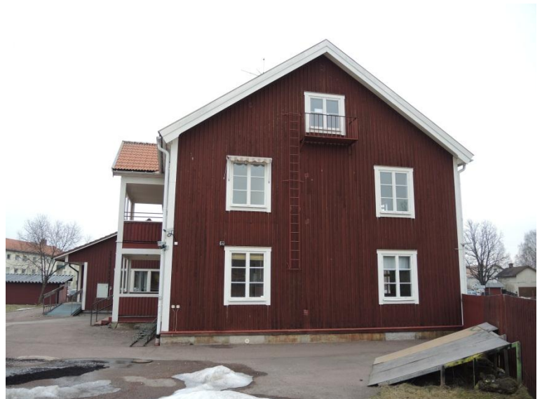
Gaveln mot sydväst.