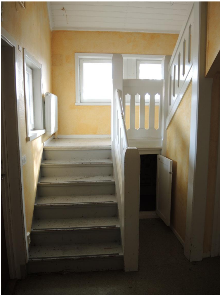
I trapphusen finns bevarade snickerier.

Byggnaden bör vara möjlig att bevara och byggas om till bostäder utan att de kulturhistoriska värdena, varken de exteriöra eller de interiöra, förvanskas.