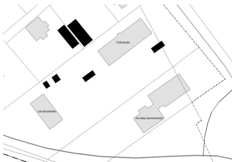
Byggnadernas läge på tomten.

Morkarlby folkskola, lärarbostaden och Zornska barnhemmet är placerade på varsin sida om en rektangulär gårdsplan. Gårdsplanen var tidigare öppen mot gatan, men omsluts nu genom en carportslänga. Byggnaderna ligger inte mittemot varandra, utan alla är lite förskjutna mot varandra. Lärarbostaden ligger lite för sig själv och har en trädgårdstomt. Rakt över gårdsplanen mellan skolan och lärarbostaden finns ett staket.