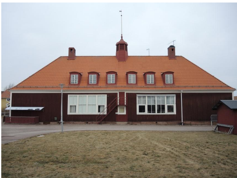
Framsidan, mot sydöst.