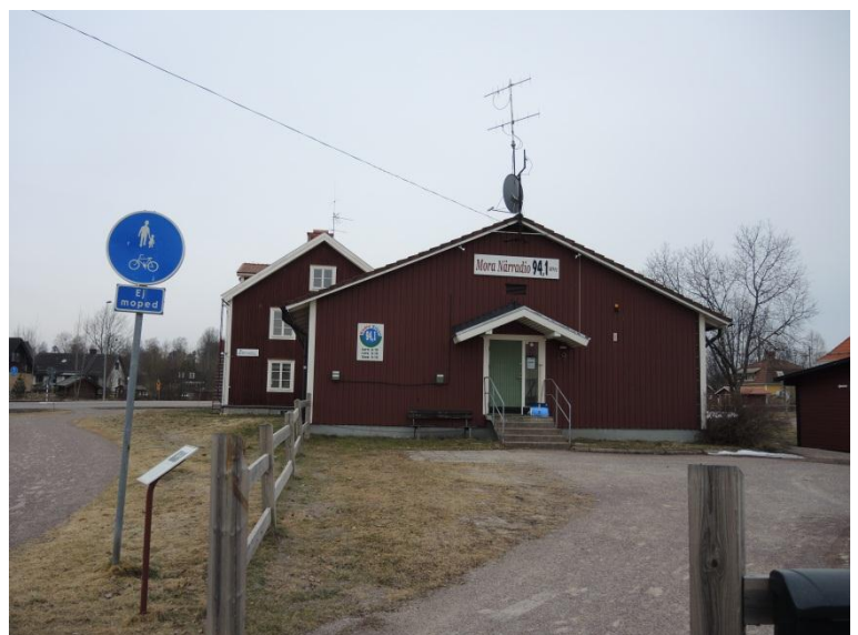
Tillbyggnadens entré från nordöst.