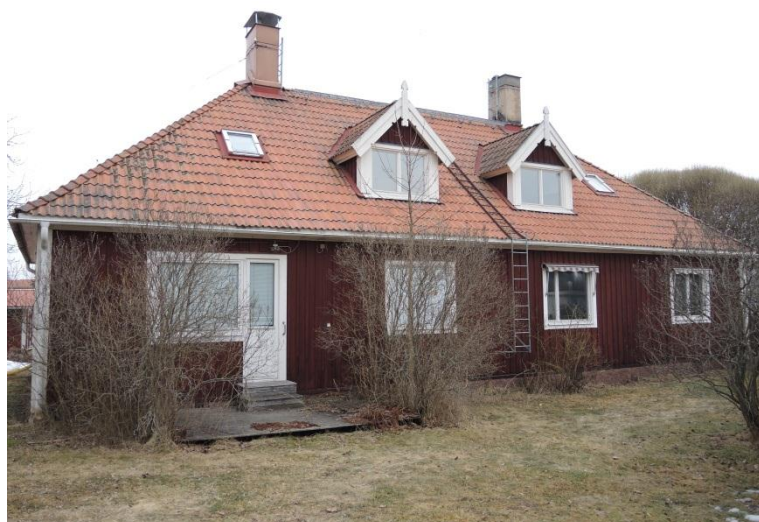
Baksida mot sydväst.