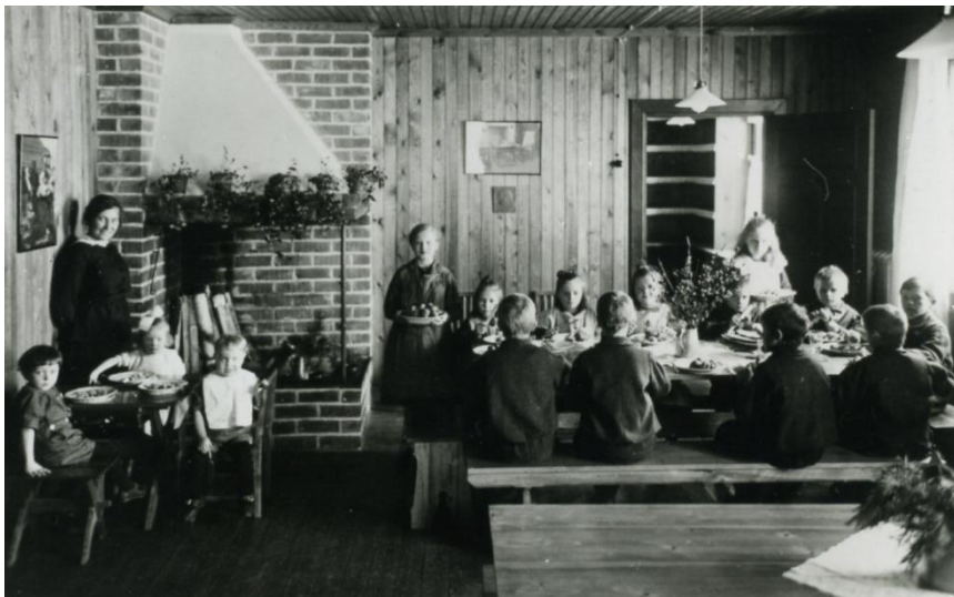
Från matsalen på barnhemmet.