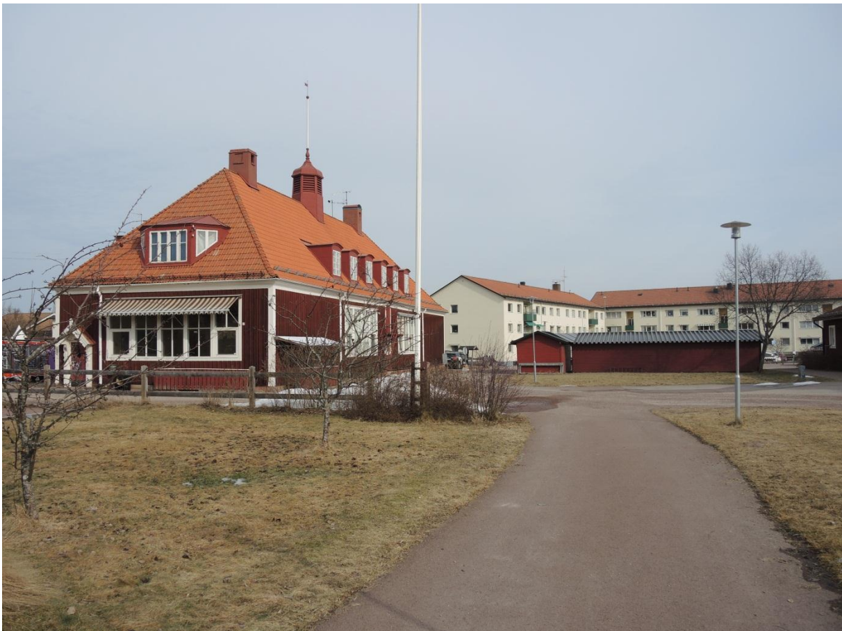
Folkskolan med skolgården.

Eftersom de kulturhistoriska värdena främst finns i byggnadens exteriör bör en ombyggnad till bostäder vara möjlig. Detta kan även innebära ändring av planlösningen, vilket dock inte bör tillåtas påverka de glasade partierna negativt. Notera att denna undersökning inte har studerat byggnadens byggtekniska skick.