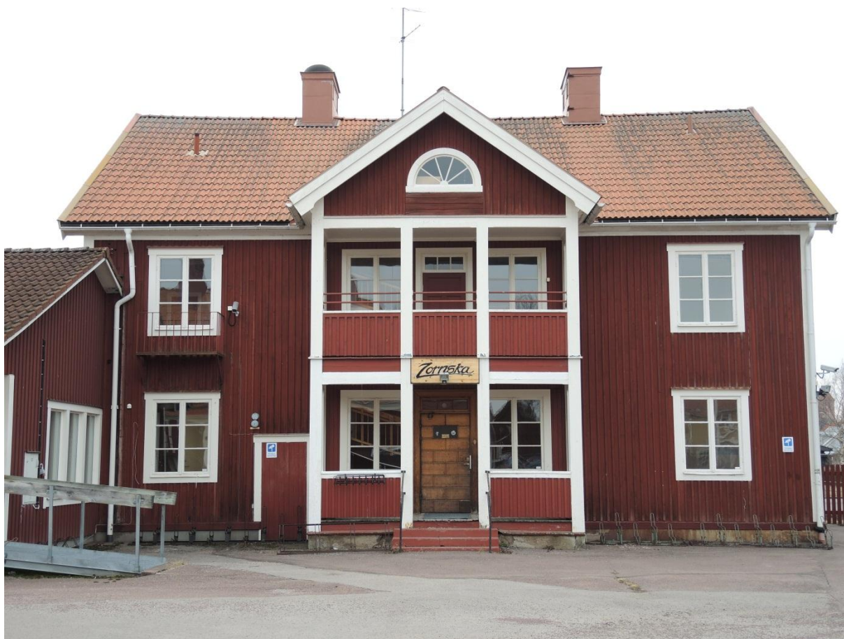
Zornska barnhemmet, framsidan mot nordväst.