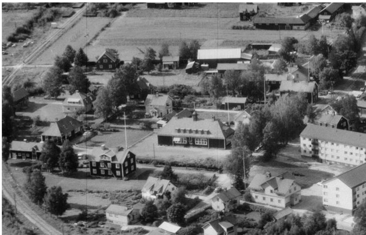
Flygbild över Morkarby från 1966. Bilden är beskuren.

Zornska har en mycket intressant historia genom att barnhemmet grundades av makarna Zorn och utgör ett av Moras Zornminnen som kan berätta om makarnas filantropiska gärningar. Byggnaden innebär ett identitetsvärde för många personer, som bibehålls av minnen om platsen. Byggnadens fysiska form och gestaltning kan inte berätta denna historia.