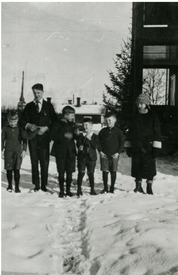
Några av barnen med verandan i bakgrunden. Årtal okänt.

Vid detta tillfälle innehöll byggnaden två våningar med källare med bagarstuga och tvättstuga. I bottenvåningen fanns kök, skafferi, serveringsrum, matsal och arbetsrum. Matsalen hade öppen spis. På bottenvåningen fanns även två rum för barnens aktiviteter; ett med skomakare- och hyvleribänkar för pojkarna och ett rum avsedd för flickornas handarbeten. I tredje våningen fanns två sovrum för pojkar och ett för flickor, badrum samt föreståndarinnans och biträdets rum. 15 Vid starten bodde fem flickor och åtta pojkar på