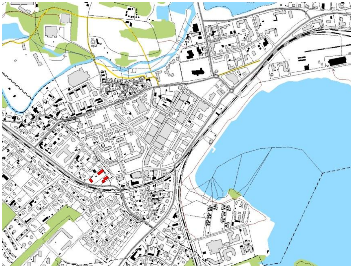
De undersökta byggnadernas läge i Mora (byggnaderna markerade i rött).

Dalarnas museum har på uppdrag av Stadsbyggnads-förvaltningen Mora Orsa genomfört en kulturhistorisk värdering och antikvarisk konsekvensanalys rörande Morkarlby folkskola, lärarbostaden samt Zornska barnhemmet. Uppdraget har förorsakats av planerna att påbörja en detaljplan för att möjliggöra bostäder på fastigheterna.