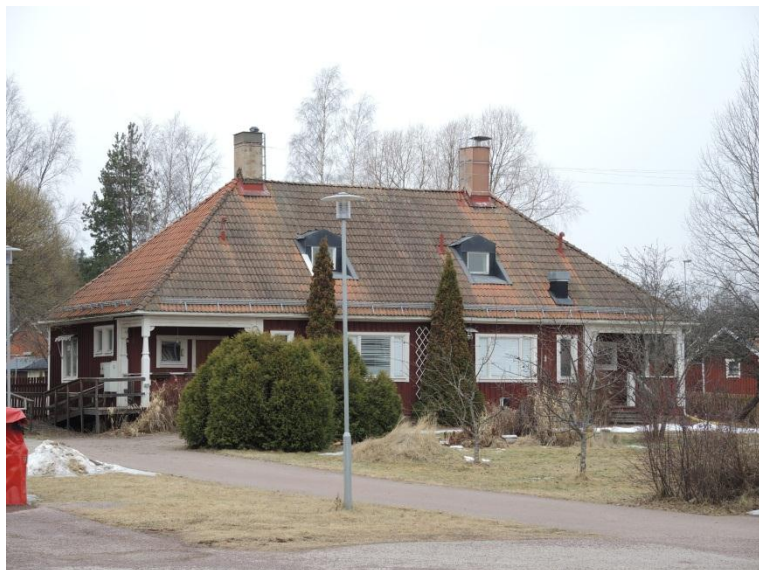
Framsida mot nordöst.

Byggnaden har två likadana lägenheter med varsin trappa. De historiska delarna finns främst bevarade i snickerier och inredning. Ursprungliga dörrar, lister, trappor och kakelugnar finns kvar i byggnaden. Vid trapporna är väggarna fortfarande klädda med