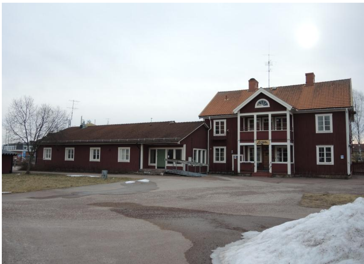
Zornska och tillbyggnaden från 1981.

Under slutet av 1970-talet och under 1980-talet hade Sällskapet Länkarna och Ekumeniska nämnden (Riastugan) sina lokaler i byggnaden. 1981 byggdes huset ut med en lägre byggnadskropp, som skulle utgöra ett hem för alkoholskadade. Utbyggnaden ritades av Byggkonsult Mora, och det är idag där Radio Siljan idag har sina lokaler. 1988 söktes bygglov för att riva de uthusbyggnader som uppfördes för barnhemsverksamheten. De ansågs inte behövas bevaras ur kulturhistorisk synvinkel och rivningslovet beviljades. Byggnaderna utgjorde troligen de stall där barnhemmets djur huserade. I slutet av 1990-talet hade handikappföreningarnas samarbetsorgan sina lokaler i byggnaden. 2006 uppförde Tekniska förvaltningen i Mora kommun källsorteringshuset samt carporten med fem platser mellan Zornskas tillbyggnad och gamla skolan. Byggnaden täpper igen all sikt från gatan. 20