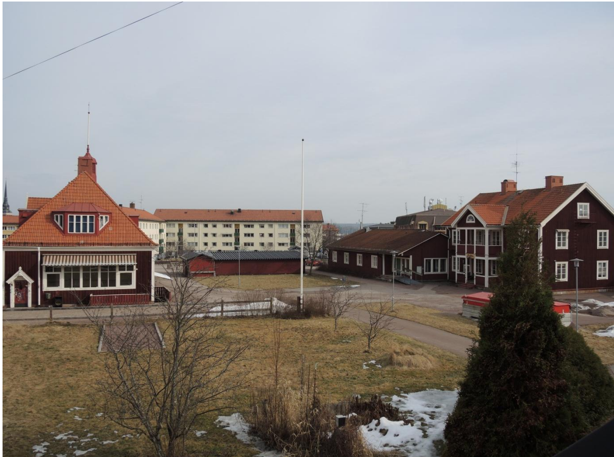
Utsikt från lärarbostaden.

Museet vill dock tydligt framhålla att någon medborgardialog i denna fråga inte utförts i arbetet med denna kulturhistoriska värdering/konsekvensanalys. En medborgardialog bör utföras innan områdets framtid beslutas. Morabornas känslor kring och uppfattning om Zornska barnhemmets byggnad som sådan bör nog utredas innan en rivning överhuvudtaget kan komma ifråga. Även Zornsamlingarnas/Zornmuseets åsikter bör inhämtas i frågan.