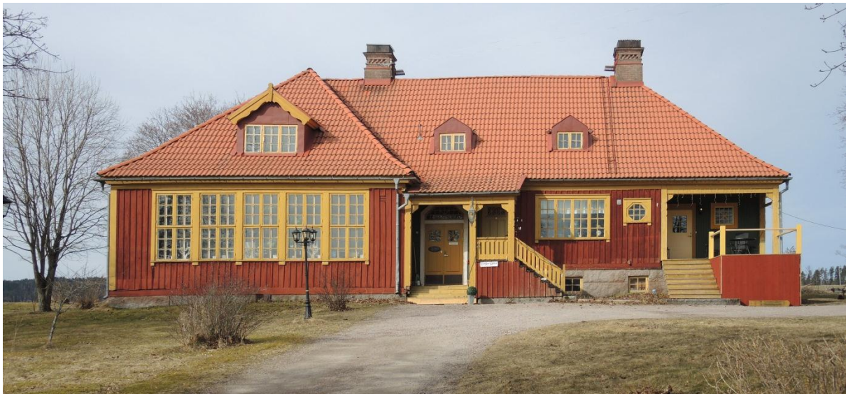
Folkskolan i Gröntuv i Gagnef, som har en slående likhet med Morkarlby folkskola.