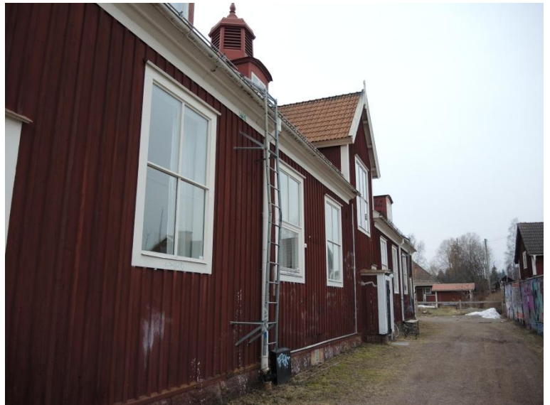
Baksidan mot nordväst.