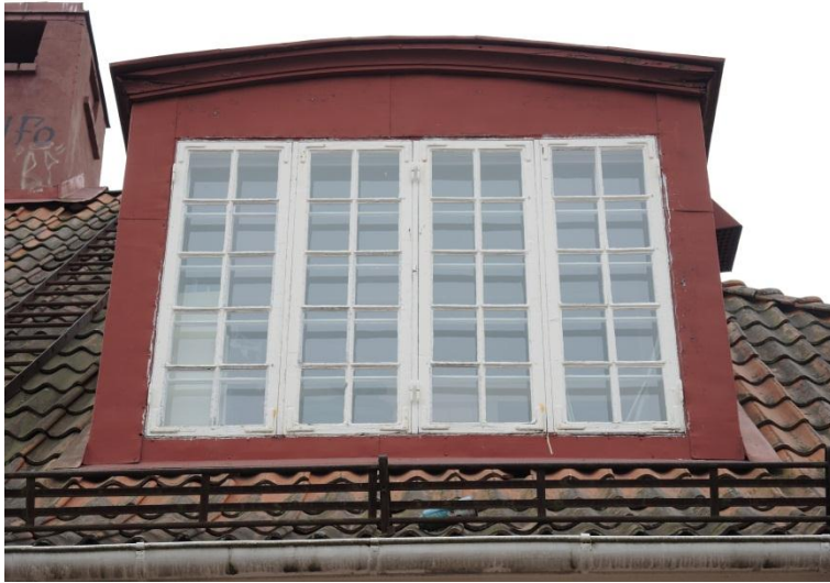
I takkuporna finns de spröjsade fönstren bevarade.