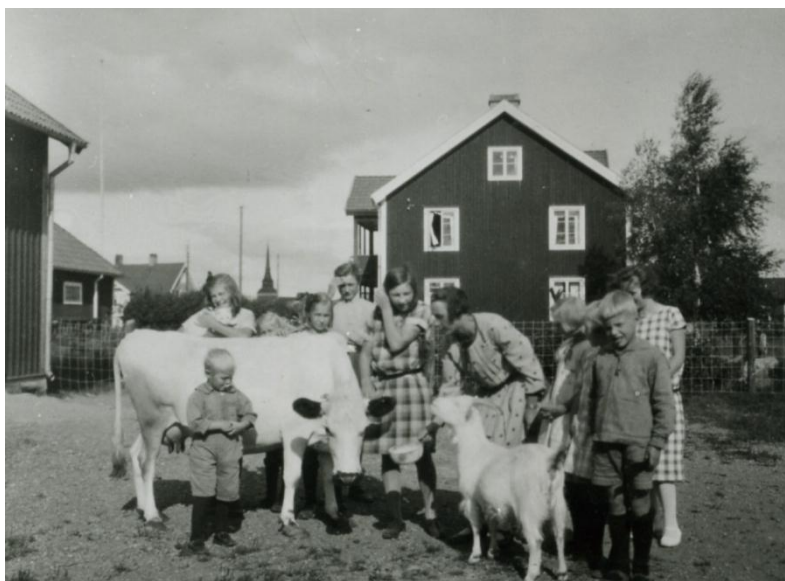
Några av barnen tillsammans med hemmets ko. Sydvästra gaveln syns i bakgrunden.