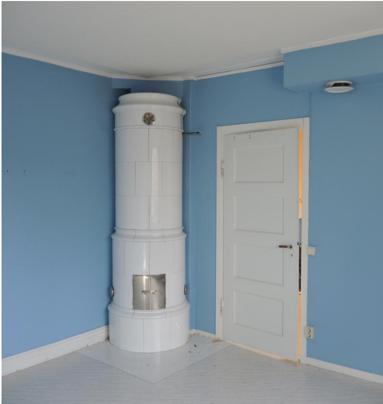
Ursprungliga kakelugnar har bevarats.

ursprunglig pärlspont, som dock fått en senare rollad bemålning. Vissa golv är de ursprungliga trägolven, som dock troligen ursprungligen var täckta med linoleummattor. I ena köket är spiskåpan i plåt bevarad.