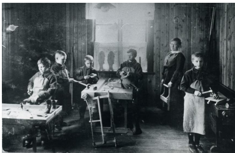
Några av pojkarna i slöjdsalen. Årtal okänt.