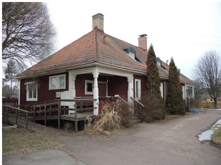
Den södra ingången.