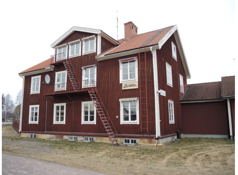
Baksidan mot sydöst.

Det finns få historiska delar kvar i interiören. Samtliga väggar har fått nya moderna beklädnader under 1990-talet. Innertaken har klätts med vita skivor och golvet täckts med plastmattor. Några få spegeldörrar finns bevarade men flera av dörrarna är täckta med masonit och det var vid besöket otydligt om vissa av dörrarna är övertäckta spegeldörrar. I samlingsrummet dock finns den ursprungliga öppna spisen kvar.