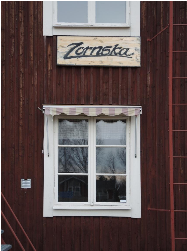
Barnhemmet med Zornska-skylden på baksidan.

Byggnaden har en mycket intressant historia genom att barnhemmet grundades av makarna Zorn. Detta innebär att byggnaden utgör ett av Moras Zornminnen. Det finns många personer som har minnen kopplade till verksamheten i byggnaden. Byggnadens fysiska form och gestaltning kan inte berätta om dess historia. Byggnaden har inte heller särskilda arkitekturhistoriska värden, utan har i stort en gestaltning som är representativ för större villor från 1910-talet. Volymen kan berätta om att byggnaden inte använts som privatbostad för en familj, men kan inte berätta exakt vilken verksamhet som bedrivits i byggnaden, eller vem som initierade denna verksamhet.